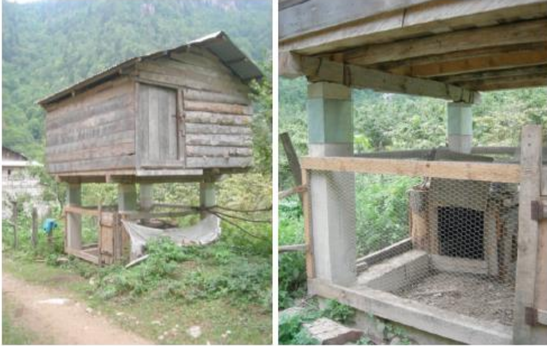
Fotoğraf 12 - 13. Alancık Köyü'nde beton direkler üzerine inşa edilmiş ve altı kümes olarak kullanılan çok amaçlı ahşap serender.

derlerin en önemli özelliği yapının içinde yer alan mahsulün korunması için (önceki serenderlerde kullanılan tekerler yerine) beton direklere çinko levha sarılarak inşa edilmiş olmalarıdır (Foto 12, 13).