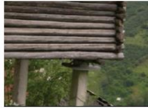
Fotoğraf 10-11. Alancık Köyü Kuzalan Mahallesi'nde beton direk üzerine düzgün ağaç kütüklerden inşa edilmiş serender.

Yörede en yeni diyebileceğimiz serenderler ise ayakları yine beton, gövdeleri de ahşap tahta duvarlardan inşa edilmiş olanlardır. Bu son grupta yer alan seren-