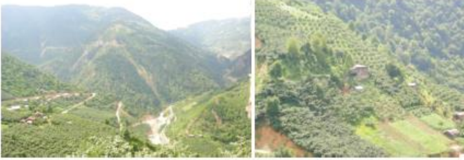
Fotoğraf 2 - 3. (Aksu Çayı Havzası, Dereli İlçesi), Alancık Köyü Kuzalan Mahallesi.