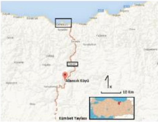
Şekil 1. Dereli ilçesi Alancık köyü lokasyon haritası

Serender ve ambarlarla ilgili olarak yukarıda bahsedilen genel özellikler Aksu Havzası için de geçerlidir. Bölgenin yoğun bir göç yaşadığı herkesin malumudur. Bu göç sonucunda kırlar boşalmakta, eskiden mısır tarımının yoğun olarak yapıldığı mevcut tarım alanları ise büyük ölçüde fındık bahçelerine dönüşmüş bulunmaktadır (Yılmaz 2008). Ekili alanların dikili hale gelmesi sonucu mısır için gerekli olan serenderlere de ihtiyaç kalmamış, zamanla bölgede bulunan serender ve ambarlar yok olup gitmiştir. Fakat deniz seviyesinden 700-800 m yukarılardan itibaren fındık tarımının iklimden kaynaklanan elverişsiz durum nedeniyle önemini kaybetmesi sonucu bu alanda yer yer mısır tarımı devam etmekte, buna bağlı olarak da bir kısım serenderler varlıklarını muhafaza ederken, yeni ihtiyaçlara yönelik olarak yeni tarz serenderler de inşa edilmektedir. Araştırma sahasının orta kesimlerinde yer alan Dereli ilçesine bağlı Alancık köyü bunlardan biridir (Şekil 1), (Fotoğraf 1, 2, 3). Köye bağlı mahallelerde yer alan eski ve yeni serenderler bunun en açık kanıtıdır.