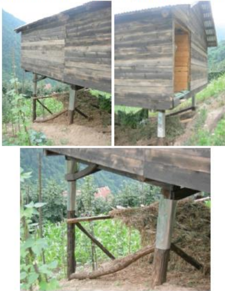
Fotoğraf 6-7-8. Alancık Köyü Kuzalan Mahallesi'nde yeni inşa edilmiş bir serender.

gövde arasına konulan çinko levhalardır. Geçmişte fare ve diğer zararlı haşeratin ambara ulaşmasını engellemek için kullanılan tekerler artık yoktur. Bunların yerini direklere dikey yönde sarılmış, yaklaşık 50 cm uzunluğundaki çinko levhalar almış olup, bunlar eskilerin tekerlerinin vazifesini görmektedir (Fotoğraf 6, 7, 8). Çinko levhanın buradaki görevi zararlıların direkleri takip ederek yerden yukarıya doğru çıkarak ambara ulaşmasını engellemektir. Eski yapılarda görülen tekerler, zararlıların ambara ulaşma çabası esnasında ters yönde hareketini zorunlu kılıyor, bu durumda da yer çekiminin etkisi ile zararlıların ambara ulaşmadan yere düşmesi hesaplanıyordu. Çinko yüzeyi tırtıklı olmadığı için zararlıların turnakları ile buna tutunmaları mümkün olmadığından tekere gerek kalmadan yine yerçekiminin etkisi ile zararlıların ambara ulaşması engellenmiş olmaktadır. Bu sistem işe yaramış olmalı ki yeni yapılan diğer serenderlerde de benzer yöntem uygulanmış olup, bu tip serenderlerin sayısı hızla artmakta, yeni yapılanlar bu teknikle donatılmaktadır.