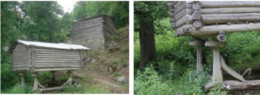
Fotoğraf 4 - 5. Alancık köyü Kuzalan Mahallesinde eski bir serender.

Araştırma sahasında görsel anlamda çekici ve estetik değerlere sahip serenderler kalmamıştır. Bunların yerine düz kütüklerden semer tipi bağlantı tekniği kullanılarak inşa edilmiş beşikörtlü serenderlere rastlanmaktadır (Fotoğraf 4, 5). Bunların gerek inşa tarzları ve büyüklükleri gerekse fonksiyonel özellikleri diğer serenderlerle aynıdır. Burada görülen istisnai durum serenderleri zararlı haşerattan koruyacak olan ayaklar üzerindeki tekerlerin bir kısmı beton döküm iken diğer bir kısmı ağaç tomrukunun enine kesilip, bunların amaca uygun yontulmasıyla elde edilmiş olmalarıdır. Direklerin her biri yay şeklinde biçimlendirilmiş ağaç kütüklerle desteklenmiştir. Serendere ulaşan merdiven ise her zaman olduğu gibi yine seyyardır. Duvarların inşasında ise biçilmiş düz kalaslar yerine son derece düzgün kütükler kullanılmıştır. Geçmişte hartama ile örtülü olan çatı günümüzde sac örtü ile yer değiştirmiştir.