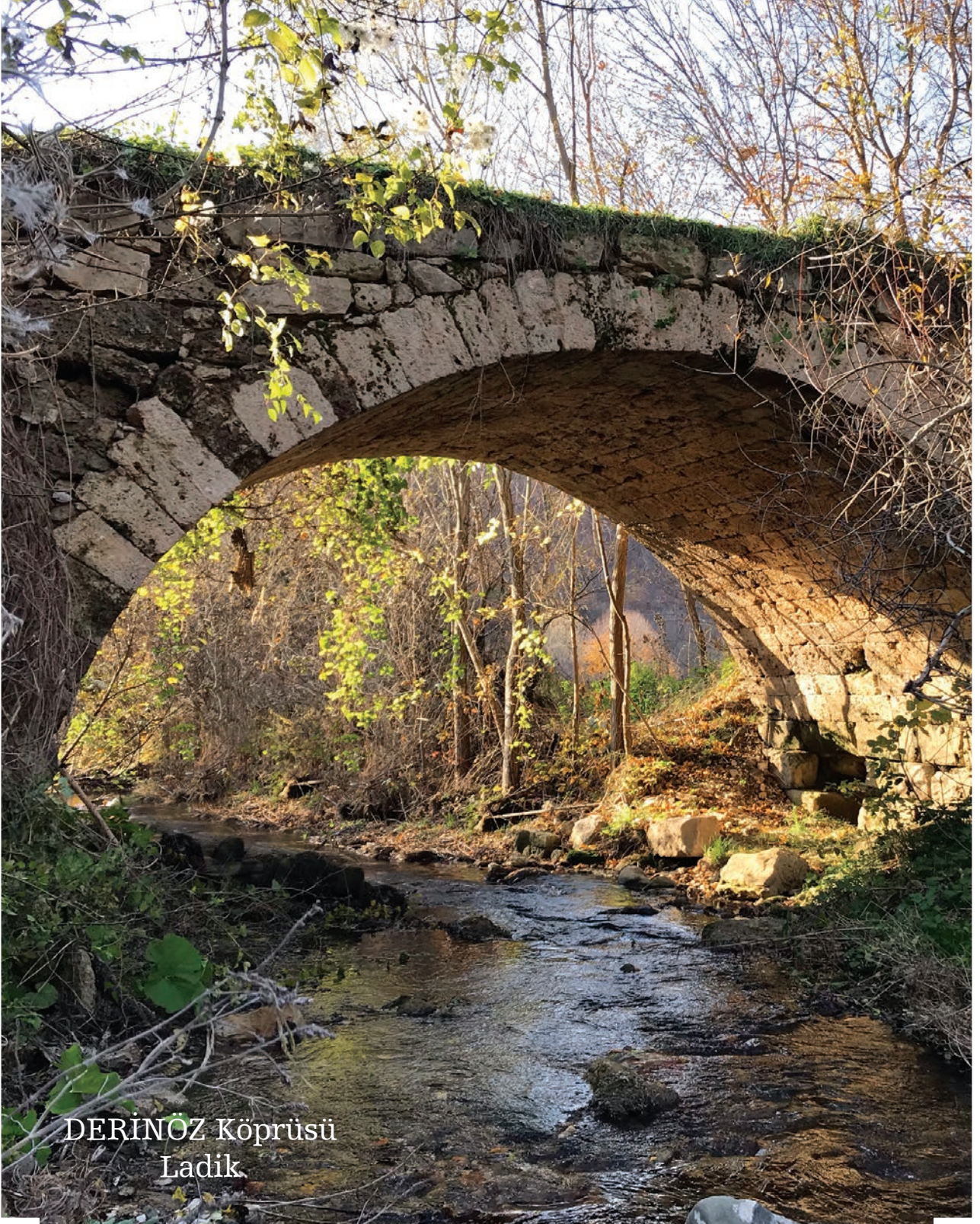
DERİNÖZ Köprüsü Ladik