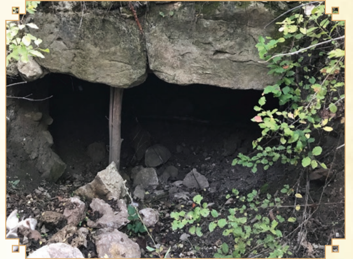
Han'a ait temel taşları

rin kalıntısı olan iki kasvetli kolon yer alır. Çevredeki insanlar, sabah bir bayram havası içinde burada toplanırdı. Üstlerine akla gelen her rengin bulunduğu yelekler, türbanlar, gömlekler giymişlerdi. Seyahatimiz boyunca ilk kez bir leylek grubunu da Ladik çevresinde gördük.