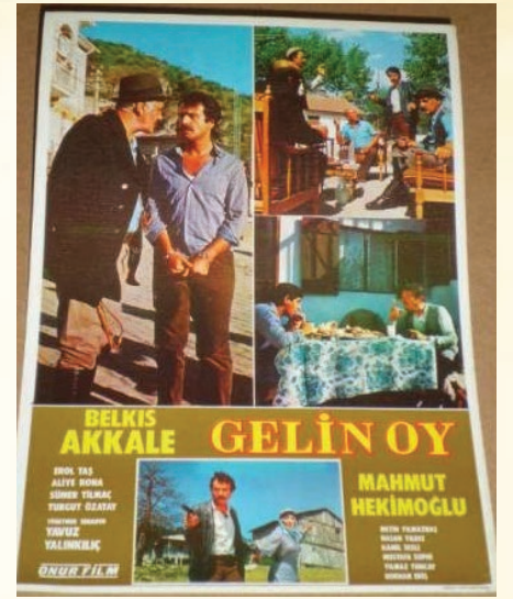
Başrollerinde Belkıs Akkale, Mahmut Hekimoğlu, Sümer Tilmaç, Erol Taş, Turgut Özatay, Aliye Rona gibi ünlülerin rol aldığı "Gelin Oy" Filminin Afişi

ları tarafından "Ferat Angun" ismi beğenilmeyince sahne ismi olarak "Ferhat Akın" ismini kullanır. Atakan Plaktan on beş, Ödemiş Plaktan üç olmak üzere on sekiz plağa arkalı önlü olmak üzere çoğunun sözlerini kendisinin yazdığı ve kendi bestelediği otuz altı türkü okur. 1972 yılında Almanya'ya işçi olarak gider. Bu yıllarda Türkiye'den uzaklaşmak durumunda kalan Ferhat Akın, Almanya'da da müzikten ayrı kalmaz. 1988 yılında Almanya'da yaşıyorken Alparslan Kasetçilikten bir yönünde yedi, diğer yönünde de yedi tane türkünün yer aldığı toplam on dört türküyü içeren bir de kaset