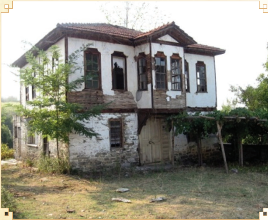
Kuzören Köyü Ahşap Camii

Yöresel el sanatları ve yemekler ile kadınların kültür ve yaz turizmine yaptıkları katkı yadsınamaz. Bu nedenle, kadınlar, girişimcilik adına desteklenmeli, tesis ve kül-