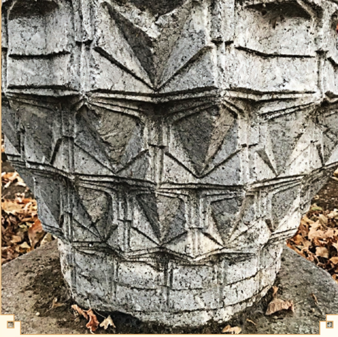
Davut Paşa (Çarşı merkezindeki) Camiinden kalan tek sütun başlığı. Maalesef kesme taşlardan ve sütunlardan hiç biri yok.