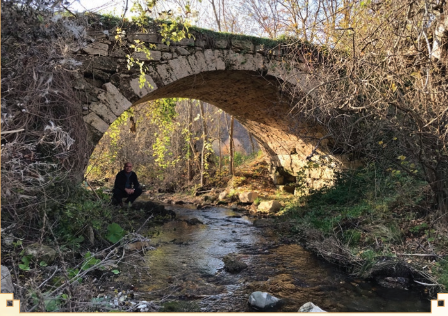
Tarihi DERİNÖZ Köprüsü (Meşepınarı Mah.)