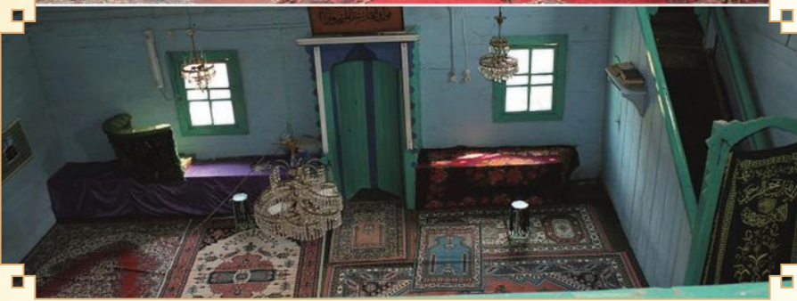
Kuzören Köyü Ahşap Camii