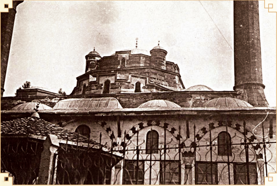
Davut Paşa (Merkez) Camii