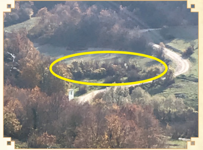
Derinöz Köprü civarında kalıntıları bulunan Han'ın yeri