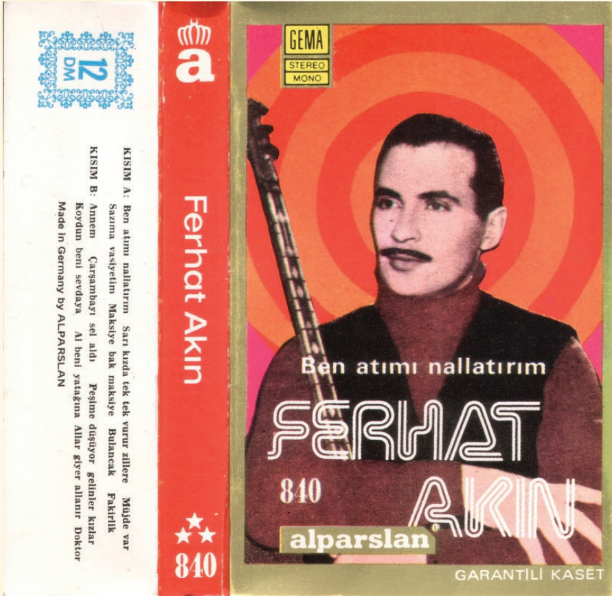
Almanya'da 1988 yılında çıkardığı kasetin kapağı