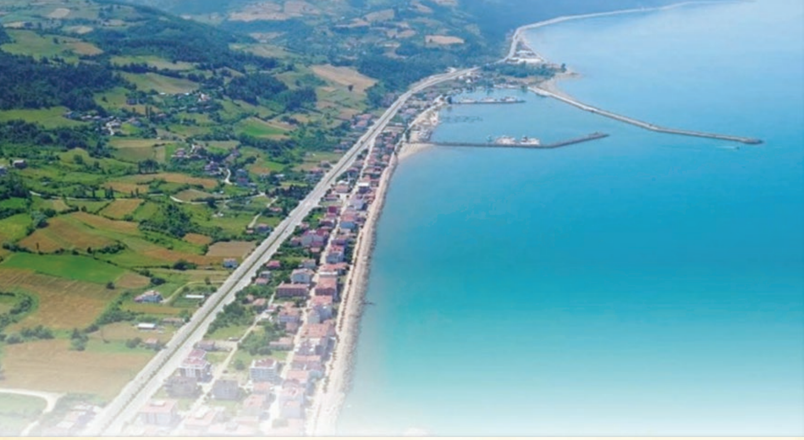
Yakakent'ten Bir Görünüş