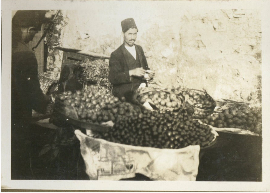
Osmanlı dönemi şehir ve kasabalarında sokak satıcıları