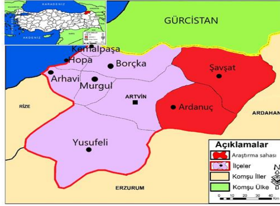
Şekil 1: Araştırma sahasının lokasyon haritası.

nin dağlık yapısı tarım alanlarını sınırlandırmış; sanayi gelişmemiş, uzak şehirlere, pazara uzaklık gibi nedenlerle ekonomik çeşitliliğin az olması genç nüfusun göçünü tetiklemiştir. Saha, dağlık ve engebeli yer şekli yapısı ve nispeten yarı kurak ve çetin kış koşullarıyla karakterize olup buna bağlı olarak sosyo-ekonomik fırsatlar açısından dezavantajlı durumdadır.