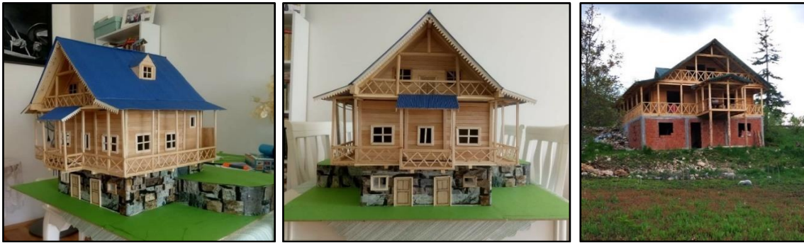
Fotoğraf 1: Covid-19 pandemisi döneminde bir emeklinin evinde tasarladığı ve hobi

Şehirde buldukları dönemlerde köye dönme isteğini canlı tutan katılımcılar, pandemi döneminde köylerinde yapmak istediklerini tasarlamışlardır. Katılımcılardan biri (KK1), Covid-19 döneminde, inşa ettirmeyi istediği evin önce maketini yapmış ve ardından köyüne döndüğünde projesini gerçekleştirmeye çalışmıştır (Fotoğraf 1). Bu süreçte karşılaşılan önemli sorunlar, yapı malzemesi temininde güçlük, yerelde yapı ve taş ustası bulunamaması olarak ifade edilmiştir; "Orman İşletme'den yapı malzemesi alımı için bir yıl köyde ikamet şartı var, orman köylüsü olduğum halde. Mesela evin ikinci katını ahşap yapabilmek için 43 m 3 malzeme kullandım, oysa bana verilen 12 m 3 idi. Köye dönmek isteyenlere bu yüzden teşvik verilmesi lazım, orman köylerine dönenlerin malzeme konusunda desteklenmesi faydalı olur."