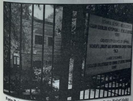
Foto 7. Hasene Ilgaz'a ait arşivin bulunduğu İstanbul-Eyüp-Balat'daki Kadın Eserleri Kütüphanesi ve Bilgi Merkezi

Bunlar içinde; Yeni Defne, Türk Çocukları, Eflatun, Yeni Adam gibi dergilerde yazdığı yazılarla çeşitli gazetelerde yayımlanmış yazıları, toplumsal konularla ilgili kitaplar, çeşitli konferans, seminer ve toplantılarda yaptığı konuşmaların metinleri ve kişisel düşüncelerini not ettiği defterlerin yanı sıra 1943-1950 arası milletvekilliği yaptığı döneme ilişkin (TBMM VII. Dönem Hatay, VIII. Dönem Çorum) belgeler, meclis tutanakları, kanun tasarıları, Cumhuriyet Halk Partisi broşürleri ve faaliyet raporları, Türkiye Çocuk Esirgeme Kurumu, Türk Dil Kurumu, Türk Kadınlar Birliği, Türk Tarih Kurumu, Kadınları Koruma Derneği, Darülaceze, Türk Ekonomi Kurumu gibi kurumların çalışmalarına ait belgeler yer almaktadır. Ayrıca aldığı ödüller, fotoğraflar, haritalar, kartpostallar, etkinlik davetiyeleri, basında çıkmış haber ve yazıların kupürleri gibi birçok belge daha arşivde yer almaktadır.