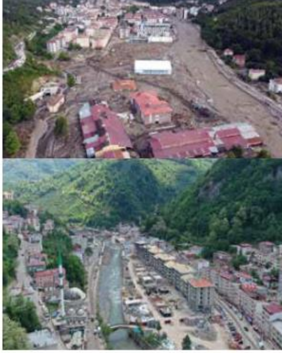
Foto 1-2. 11 Ağustos 2021 selinin yaşandığı Bozkurt ilçe merkezi. Benzer felaketi daha önce yaşayan Giresun-Dereli'de afet sonrası yine dere içinde gelişen yapılaşma.

cel örnekler Orta ve Doğu Karadeniz Bölgeleri'nde görülmektedir. 11 Ağustos 2021 tarihinde yaşanan Kastamonu-Bozkurt, Sinop-Ayancık ve bunlardan daha önce yaşanan Giresun-Dereli örnekleri, Orta ve Doğu Karadeniz kıyı kuşağında son birkaç yıl içinde yaşanan sel ve taşkınlardan zarar gören yerleşmelerdir (Foto 1-2).