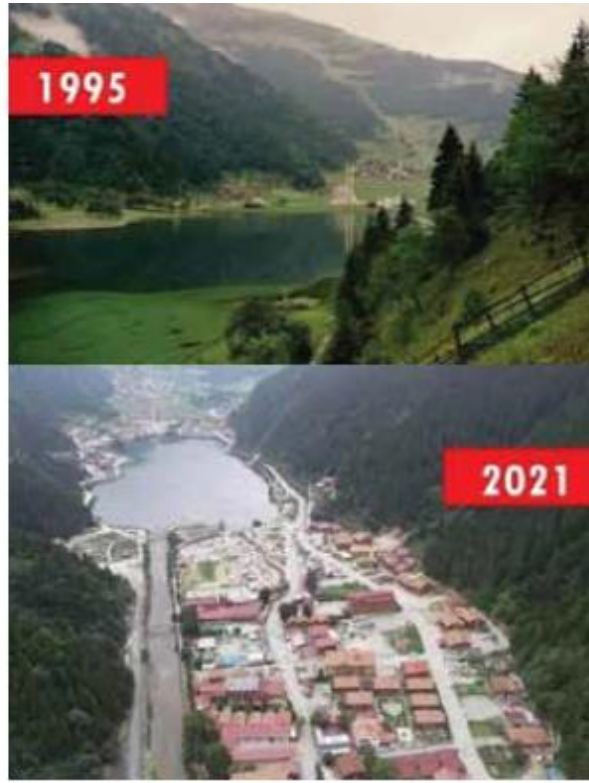
Foto 7-8. Trabzon-Uzungöl 25 yıllık süreçte görülen değişim.

İç talebe ek olarak dış (yabancı turist), özellikle Arap turistlerin Karadeniz Bölgesi'ne olan ilgisi görülmektedir. Misal, Trabzon ve Rize'ye en çok talep Ortadoğu'dan, Arap ülkelerinden gelmektedir. Dolayısıyla günümüzde Trabzon'da bu talebe bağlı olarak, yaylaların nasıl değerlendirileceği konusu gündeme gelmektedir. Yine yaylaların kullanımıyla ilgili olarak, yaylaların yeşil yol ile birleştirilmesi söz konusu olmuş ve bu kısmen gerçekleştirilmiştir (Foto 9-10).