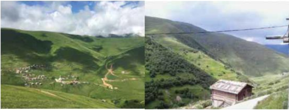
Foto 16-17. Trabzon, Çaykara, Çayıroba (Yente) köyü ve yaylası; henüz yapılaşma baskısı hissedilmiyor.

Karadeniz Bölgesi'nde yaylaların geniş alanlara sahip olmasına rağmen yaylacılar arasında sorunlar yaşanmaktadır. Otlakların bulunması yeterli olmayıp bununla beraber otlaklarda kaynak sularının da bulunması bir hayli önemlidir. Derin vadilerle yarılmış sırt alanlarda su kaynakları yetersizdir. Yamaçlardan çıkan kaynak suları ise daha fazladır. Dolayısıyla Karadeniz yaylalarında gelişigüzel ve her yerde hayvan otlatmak mümkün olmamaktadır. Bu etkilerle de yaylalarda dağınık yerleşme gelişmiştir. Bu yerleşme şekilleri göz önüne alındığında, iskân verilmesi durumunda yayladaki dağınık yerleşmelerin ihtiyaçlarının nasıl karşılanacağı bir diğer konudur. Diğer taraftan, iskân verilmemesi durumunda veyahut mevcut yapılaşmanın yıkılması veya yıkılmaması halk içinde tereddüt oluşturmaktadır.