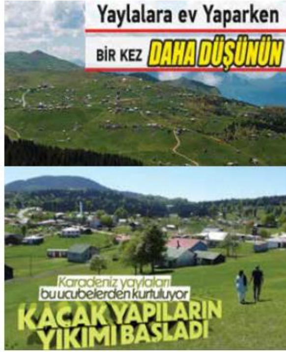
Foto 11-12. Trabzon yaylalarında daha bugünden başlayan kaçak yapılaşma ve bunlarla ilgili yıkım mücadelesi.

kılması, diğer yandan vatandaşların inşa etmesi sürecinde vatandaş, yani gecekondulaşma galip gelmiştir.