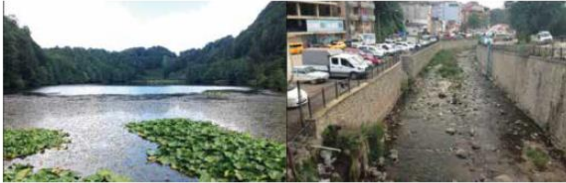
Foto 20-21. Ordu-Gölköy yaylalarından kaynağını alan akarsu, Gölköy ilçe merkezinden geçerken kirlenerek yoluna devam ediyor.

ise yaylalara gününbirlik çıkış ve inişler desteklenmeli, çevre kirliliğini de beraberinde getirebileceği için de bu en aza indirilmelidir (Foto 18-19-20-21).