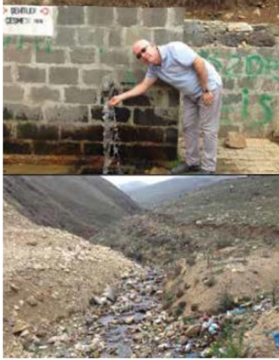
Foto 18-19. Giresun-Kümbet Yaylası Şehitler Çeşmesi. Kaynağında su pırlı pırlı, 2 metre sonrası ise katı atık ve çöplerle dolu. Geçmişte denize ulaştıkları yerde görülen akarsu kirliliği günümüzde yaylalar sahasında kaynak (membra) kısmına kadar ulaşmış durumda.