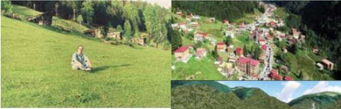
Foto 13-14-15. Rize-Ayder yaylası; 1994'teki görünümü, hızlı yapılaşma sonucu geldiği durum ve sonrasında kentsel dönüşüm kararı ile projelendirilmiş hali.