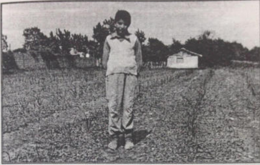
Foto-3: Tütün tarlasında getir-götür işlerinde istihdam edilen bir çocuk işçi. Henüz 12 yaşında, Durağan'dan geldi, işverenle aynı evde birlikte kalıyor.