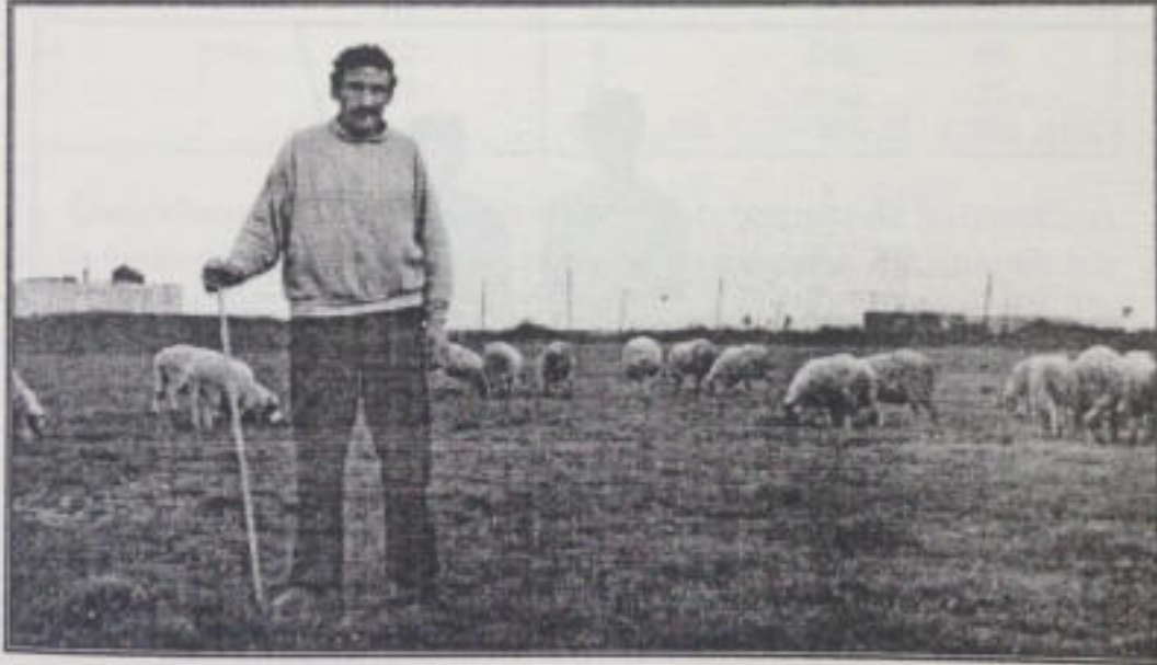
Foto4: Kışın mandırada, yazın merada hayvanlara bakıcılık eden bu çoban yörede bu tür işlerde çalışan en yaşlı kişi (34 yaşında) olup eşi ve çocuğu ile birlikte 12 ay boyunca daimi olarak çalışmaktadır.