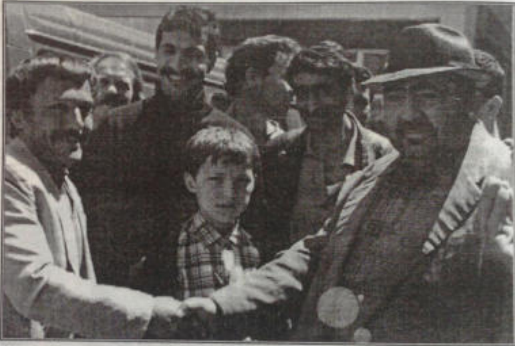
Foto-2: Aynı pazarda bir başka pazarlık sahnesi. Bu iki fotoğraf İHA tarafından tüm Türkiye'ye haber olarak geçilmiştir.

Tarafsız bir gözle bakıldığında, çalışan işgücünün mağdur edilmemesi için ücretlerin serbest rekabet ortamında mevcut en yüksek değerden hesap edilebilmesini sağlaması açısından bu yöntemin yadırganacak fazla bir yönü yoktur. Fakat bir başka açıdan bakıldığında, kiraya verilen çocukların ücretlerinin bir kısmının velileri tarafından alınarak (geri kalanı da mevsim sonunda alınmak üzere) sadece üstündeki başındaki ile yeni patronlarına teslim edilmeleri, çoğu zaman ceplerine bir kuruş harçlık dahi verilmeden pazar yerinde bırakılarak köylere geri dönülmesi gerçekten trajik bir olaydır 7 .