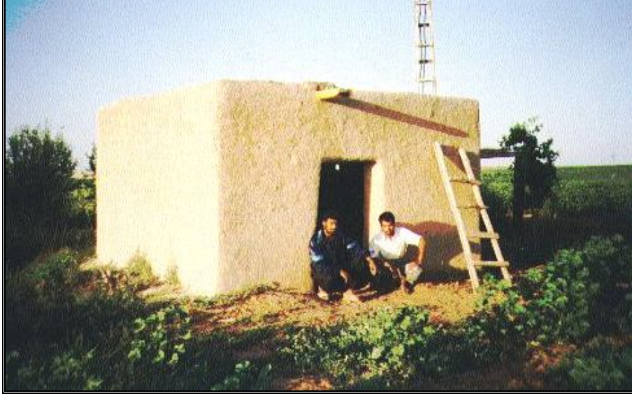
Foto 5:: Urfa-Ceylanpınar Cırcıp yöresinde kavun-karpuz tarlası içinde kerpiçten “holik”