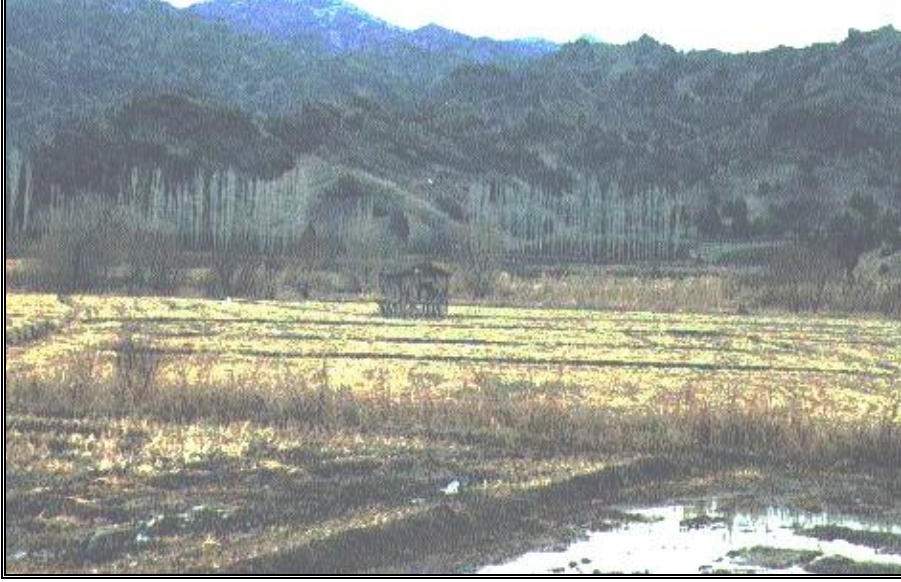
Foto 3: Kastamonu-Tosya'da çeltik tarlası içinde ahşap karkas, sac örtülü "çardak"