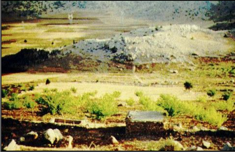
Foto 4: Amasya'da kiraz bahçesi içinde taş duvar, toprak çatı örtülü "kelik" veya "eyvan"