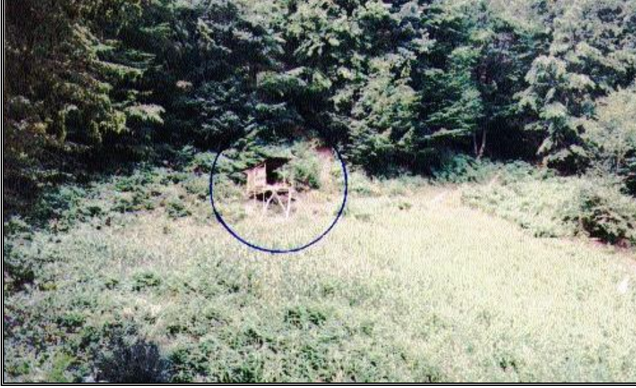
Foto 1: Sinop-Ayancık'ta mısır tarlası kenarına ağaçtan inşa edilmiş bir "gelik"