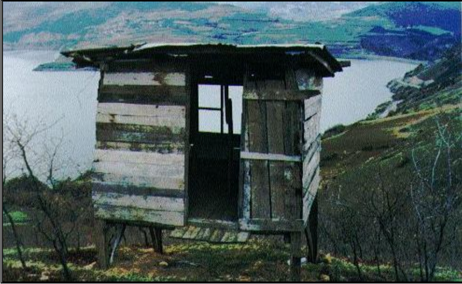
Foto 2: Samsun-Bafra, Derbent Barajı gölüne bakan yamaçlar üzerinde, fındık bahçesinin en hakim yerine inşa edilmiş bir "kelif" (fotoğraf Aralık ayında çekilmiştir)