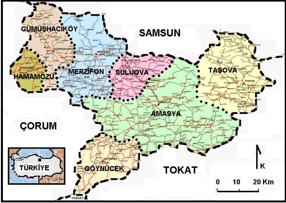
Şekil 1. Amasya il haritası.