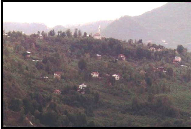
Foto 3. Erdoğan köyü genel görünüm.

Fındık tarımı deniz seviyesinden başlayarak 750 m yükseltiye kadar çıkmaktadır 4 . 0-100 m'ler arasında kalan kıyı kesiminde fındık tarımı yanında başka ek gelir imkanları da bulunduğu için bu kuşak burada 100-750 m arası olarak ele alınmıştır. Genel olarak "fındık kuşağı" olarak adlandırılan bu kesimde halkın temel geçim kaynağı fındık tarımıdır. Dünyaca meşhur Giresun kalite fındığı bu kuşakta yetiştirilmektedir. Araştırmada bu kesim için örnek alan olarak seçilen Erdoğan ve İcilli köyleri de burada yer almaktadır (Foto 3 ve 4).