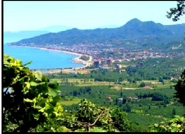
Foto 1. Pazarsuyu köyü genel görünümü.

Karadeniz Sahil Yolu'nun da etkisi ile tüm Karadeniz kıyılarında olduğu gibi Giresun ve Bulancak sahil kesiminde de yoğun bir yapılaşma göze çarpmakta, kıyı boyunca yerleşmeler alansal olarak büyüyerek birbirleri ile birleşmektedirler. Kıyı çizgisi üzerinde yer alan kasaba ve şehirlerdeki idari ve ticari iş sahaları yanında özellikle inşaat sektörü birçok kişiye istihdam sağlamaktadır. Bu durum kırsal kesimden kıyı bölgesine göçü teşvik ettiği gibi, mevcut yerel nüfusun da bu kesimde iş bulmasında ve bu yolla nüfusun yerinde tutulmasında etkili olmaktadır. Bulancak ilçe merkezine 4 ve 7 km mesafede bulunan Talipli ve Pazarsuyu köyleri kıyı kuşağının tipik özelliklerini yansıtmaları açısından önemli iki örnektir ( Foto 1 ).