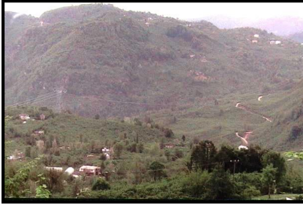
Foto 5. Ahırlı köyü genel görünüm.

750 m yükselti seviyesi fındık tarımının randımanlı olarak yapılabilirdiği en üst sınırdır. Bunun üzerinde vadi içlerine sokularak da olsa fındık tarımı biraz daha yukarılara çıkabilse de bu çok yaygın bir durum değildir. İlçe merkezine 38 ve 47 km uzaklıkta bulunan Ahırlı ve Elmalı köyleri fındık kuşağının daha yukarısında, fındık kuşağı ile ormanlık alanların iç içe geçtiği kesimde bulunmaktadır ( Foto 5 ve 6 ).