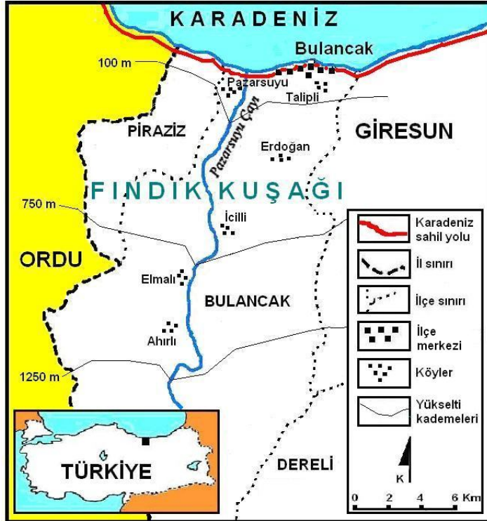
Şekil 1. Araştırma sahası.

Bu çalışmada Bulancak ilçesi örneğinden hareket edilerek, son gelişmeler ışığında Giresun kırsalında görülen bu nüfus kaybının nedenleri ve ana özellikleri üzerinde durulmuştur. Araştırmada elde edilen veriler daha önce tarafımızdan yönetilen bir yüksek lisans tezinde ayrıntılı olarak değerlendirilmiştir 1 . Bu çalışmada sunulan bilgiler ise söz konusu araştırma sırasında arazide yapılan gözlem ve bulgulara dayanmaktadır. Araştırmada Bulancak ilçesi kırsal kesimi, deniz seviyesinden başlayarak, yaylalar sahasına yakın en yüksek daimi yerleşmelere kadar olan kesimde üç kademeye ayrılarak incelenmiş, her kademede iki köy örnek alınmıştır. Birinci kademe 0-100 m yükselti arası ve burada bulunan Talipli ve Pazarsuyu köylerini, ikinci kademe 100-750 m’ler arası ve burada bulunan Erdoğan ve İcilli köylerini, üçüncü kademe ise 750-1250 m’ler arası ve burada bulunan Elmalı ve Ahırlı köylerini kapsamaktadır (Şekil 1).