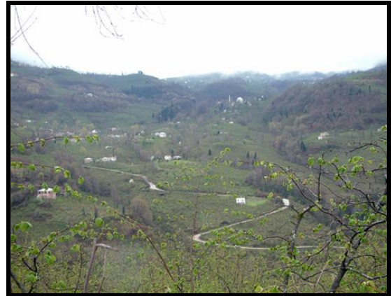
Foto 4. İcilli köyü genel görünümü.