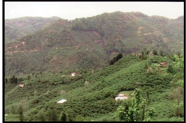
Foto 6. Elmalı köyü genel görünüm.

Bu kuşaktaki köylerin ortak özelliği; çoğunlukla ormanların tahribi sonucu açılan sahalarda, orman içinde ya da orman kenarında yer almaları nedeniyle orman köyü olmaları, tarlaların bir kısmında fındık bir kısmında da halen tarla tarımı yapmaları, yaylalardan da yararlanarak hayvancılıkla uğraşmaları ve son olarak da ek gelir için mevsimlik işgücüne katılmalarıdır. Geçmişte bu kesimde ormancılık ve hayvancılık yaygın olarak yapılırken günümüzde bu özelliğini de kaybetmektedir. Hızla artan makineleşme sonucu artık ormanlar eskisi gibi büyük oranda bedensel işgücüne talep duymamakta, yılda en fazla bir iki ay süren bir faaliyet olarak sürdürülmektedir. Bu nedenledir ki köylerde kalan yaşlı, kadın ve çocuklar daha çok tarla ve hayvancılıkla uğraşırken, gençler mevsimlik işgücüne katılmakta, bunlar yazın daha aşağı kesimde fındık toplamaya, kışın da inşaat işleri için sahil kesimine ya da büyük şehirlere gitmektedirler. Genel olarak bakıldığında Ahırlı ve Elmalı gibi Giresun'un yüksek kesimlerini temsil eden köylerde yaşayan insanlar arasında genç ve çalışabilir yaşta nüfus az olup, onların da bir kısmı köyde kalan yaşlılara bakan kişilerdir.