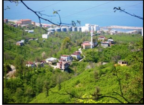
Foto 2. Talipli köyü genel görünümü.

Bunlardan Pazarsuyu Köyü Pazarsuyu Deresi kenarında, verimli alüvyal topraklara sahip bir ova köyüdür. Fındığın yanı sıra köyde Bulancak semt pazarlarında satılmak üzere sebze tarımı da gelişmiştir. Yer yer sebze seraları yanında, yine Bulancak'ın et ve süt ihtiyacına yönelik olarak ticari hayvancılık da gelişmiş, bunun için mandıralar inşa edilmiştir. Talipli köyü de hemen hemen aynı özelliklere sahiptir. Her iki köyde de yaşayan halk bu kırsal uğraşlar yanında ilçe merkezinde çeşitli işlerde çalışarak ayrıca ek gelir elde ettikleri için bu köylerden göç eden nüfus daha azdır. Bu kesimde yaşayan vatandaşlarımız ulaşım kolaylığından da yararlanarak şehirdeki işlerine gününbirlik gidip geliş yapmakta, böylece köyde kırsal faaliyetlerini sürdürürken şehirde de bu ürünleri pazarlayarak ya da