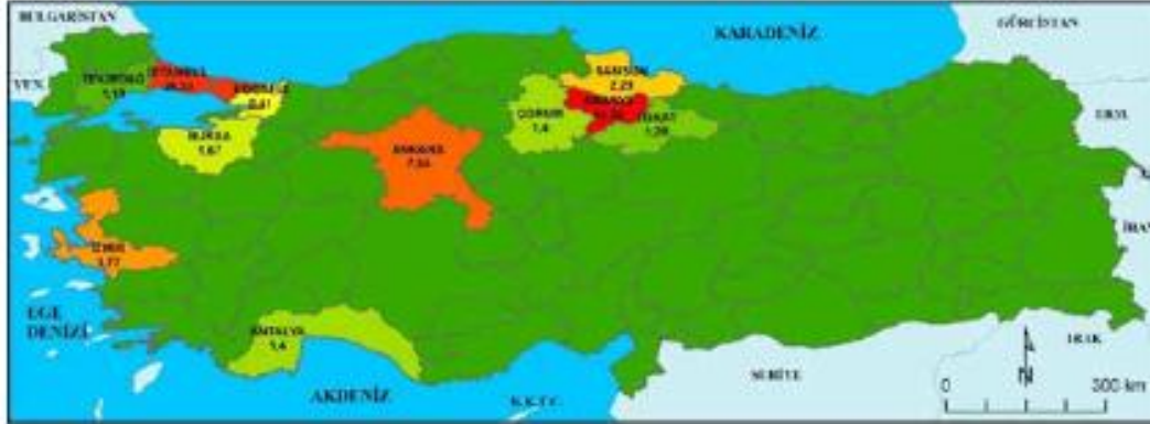
Şekil 4: Amasyalıların en fazla ikamet ettiği iller (2016)