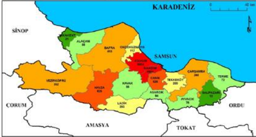
Şekil 6: Samsun'da ikamet eden Amasyalıların ilçelere göre dağılışı (2016)