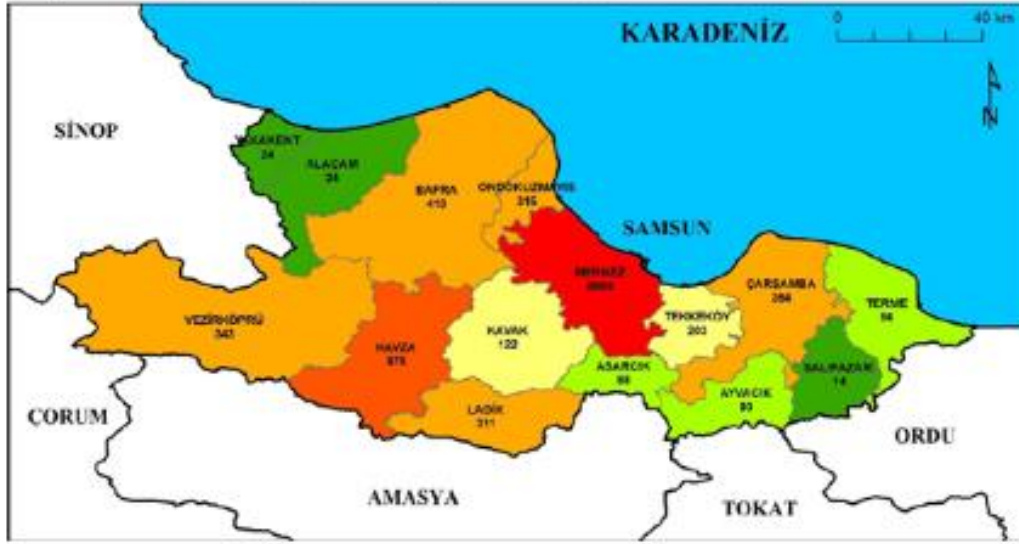
Şekil 5: Samsun'da ikamet eden Amasyalıların ilçelere göre dağılışı (2007)