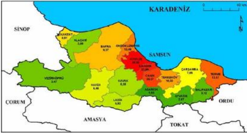
Şekil 2: Samsun'da ikamet eden diğer il nüfusuna kayıtlıların buldukları ilçe nüfusuna oranı (%) (2016)

Samsun'da ikamet eden Samsunlular 2016 yılında nüfusun %82,05'ini oluşturmaktadırlar. Özellikle yerleşim yeri olarak Samsun şehrini tercih eden diğer illere kayıtlıların Samsun il genelindeki oranı ise %17,95'tir. Samsun'da ikamet eden diğer il nüfusuna kayıtlılar arasında en yüksek orana %3,59 ile Ordulular sahiptir. Ordu'yu sırasıyla Trabzon (%3,08), Amasya (%1,13), Giresun (%1,01), Rize (%0,94) ve Tokat (%0,88) illeri takip etmektedir. Samsun'daki nüfusun %10,62'sinin kayıtlı olduğu bu iller aynı zamanda Samsun'un güney komşularıyla Karadeniz kıyısı boyunca doğusunda bulunan illere tekabül etmektedir (Şekil 3). Yılmaz (2007) Samsun'un komşu illerden ve Doğu Karadeniz illerinden 1980'ye kadar göç aldığını fakat bu tarihten sonra göçlerin azaldığını belirtmiştir.