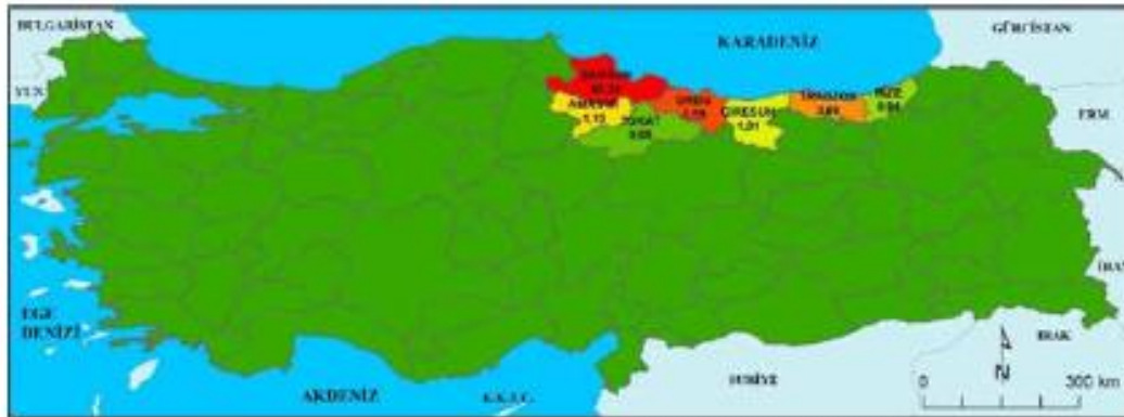
Şekil 3: Samsun'da ikamet eden nüfusun en fazla kayıtlı oldukları çevre illere göre oranları (2016)

Samsun'da ikamet eden Samsunlular 2016 yılında nüfusun %82,05'ini oluşturmaktadırlar. Özellikle yerleşim yeri olarak Samsun şehrini tercih eden diğer illere kayıtlıların Samsun il genelindeki oranı ise %17,95'tir. Samsun'da ikamet eden diğer il nüfusuna kayıtlılar arasında en yüksek orana %3,59 ile Ordulular sahiptir. Ordu'yu sırasıyla Trabzon (%3,08), Amasya (%1,13), Giresun (%1,01), Rize (%0,94) ve Tokat (%0,88) illeri takip etmektedir. Samsun'daki nüfusun %10,62'sinin kayıtlı olduğu bu iller aynı zamanda Samsun'un güney komşularıyla Karadeniz kıyısı boyunca doğusunda bulunan illere tekabül etmektedir (Şekil 3). Yılmaz (2007) Samsun'un komşu illerden ve Doğu Karadeniz illerinden 1980'ye kadar göç aldığını fakat bu tarihten sonra göçlerin azaldığını belirtmiştir.