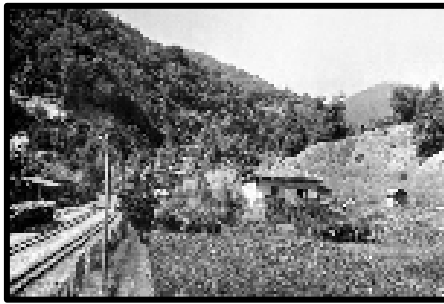
Şekil 70-71: Kazköy orman bölgesi işletme binası.

Araştırma alanında Söküçayırı köyü sınırları içerisinde bulunur. Burası hem tomruk yükleme alanı hem de fabrika çalışanlarının trene bindikleri adeta bir servis noktasıdır. Kazköy'de 1930'lu yıllarda dere suyu kullanılarak elektrik üretilmiştir. Bu elektrik üretim sistemine ait parçalar halen Közköy bölgesinde muhafaza edilmektedir. Bölgede şeflik binası, garajlar ve birkaç küçük kulübe bulunmaktadır (Şekil 70-71).