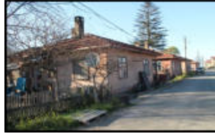
Şekil 79: Fabrika yerleşkesinde yöneticiler için yapılmış lojmanlar.