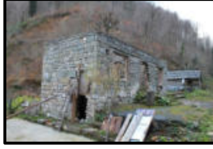
Şekil 73: Burtu bölgesi kullanılmayan işletme binaları.