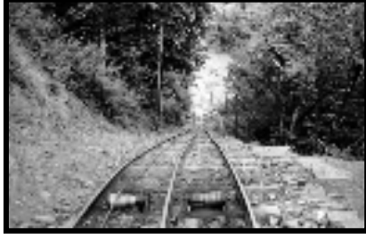
Şekil 30: Yenicealtı istasyonu vargel sistemi.