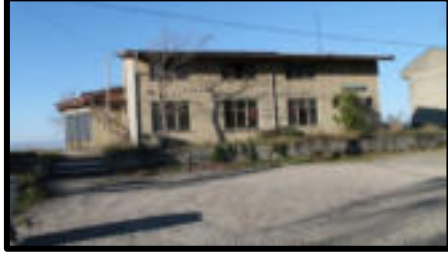
Şekil 80: Fabrika sosyal tesisleri.