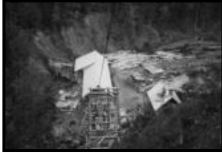
Şekil 62: Yemişli istasyonunda bulunan tomruk havuzu.