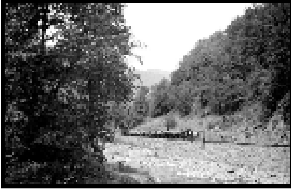
Şekil 66: İnaltı bölgesinde tomruk yüklü bir dekovil.