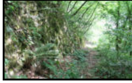
Şekil 31: Yenicealtı istasyonu vargel sisteminin geçtiği yer.