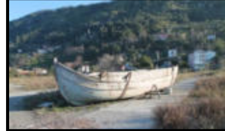
Şekil 85: Üretilen kerestenin açıkta bekleyen gemilere yüklenmesini sağlayan mavnalardan biri.

Türkiye’de endüstriyel alanların korunması konusunda sadece tespit ve koruma önlemleri konuşulurken korunan yapının nasıl sürdürülebilir olacağı hususu bazı durumlarda göz ardı edilmektedir. Çünkü uzun vadeli yapılmayan koruma planları belirli bir dönem sonra o yapı için işlevsiz hale gelecek ve korumanın bir geçerliliği kalmayacaktır. Diğer bir deyişle korumanın “neden korunduğu” hususu kadar “nasıl korunacağı” da iyice ortaya konmalıdır. Bir bölgede endüstriyel mirasa ilişkin çekiciliklerin bulunması, tek başına o alanın bir cazibe merkezi olmasına yetmemektedir. Destinasyonda bulunan endüstriyel mirasın turizme kazandırılması için birtakım düzenlemelerin