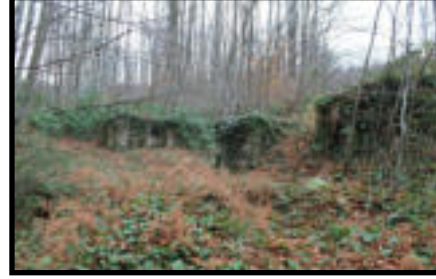
Şekil 35: 120 istasyonu güç ünitesi kalıntıları.