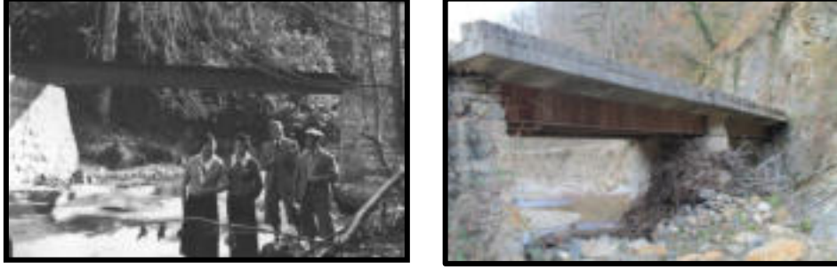
Şekil 24-25: Zindan hattında demiryolu raylarının üzerine kurulmuş bir köprü. Sadece Zindan hattında bu şekilde kurulmuş 6 köprü bulunmaktadır.

Dekovillerin virajlarda zorlanması nedeniyle demiryolu hattında sık sık köprüler kullanılarak hattın mümkün olduğunca virajsız devam etmesi sağlanmaya çalışılmıştır. Demiryolundan karayolu taşımacılığına geçildiğinde bu demiryolları ve köprüler yeni inşa edilen köprü ve yollara altyapı olarak kullanılmıştır (Şekil 24-25).