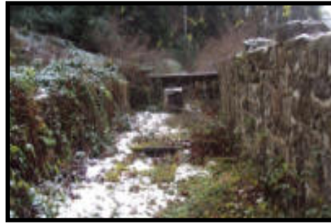
Şekil 49: 1930 yıllarda Karadere istasyonu.