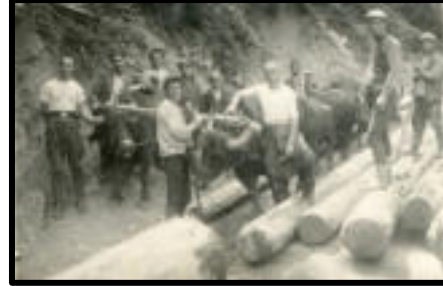
Şekil 19: Ormanda mandalarla tomruk taşınması.