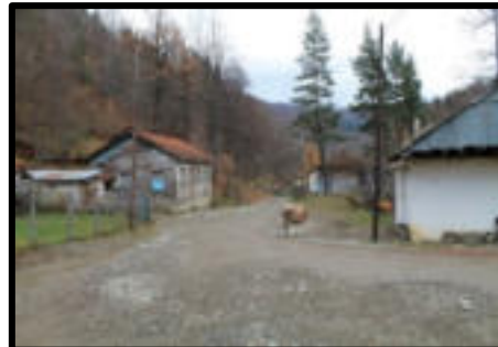
Şekil 75: Zindan bölgesinde bulunan lojmanlarda 1988 yılında meydana gelen heyelanda evleri zarar gören köylüler oturmaktadır.