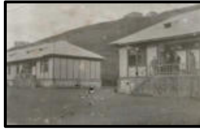
Şekil 14-15: ZİNGAL şirketine ait lojman ve barakaların kapladığı alan 1942 yılı itibariyle toplam 4.629 m 2 'dir (Zingal, 1943). 1945 yılına kadar toplam 35 lojman ve baraka inşa edilmiştir.

Şehirde sportif ve sosyal alanların inşasında da fabrika önder olmuştur. Kendi personeli ve halkın sosyal hayatına katkı sağlayacak tenis kortu, futbol, voleybol ve basketbol sahası, sanatsal etkinliklerin gerçekleştirebileceği birimler inşa edilmiştir.