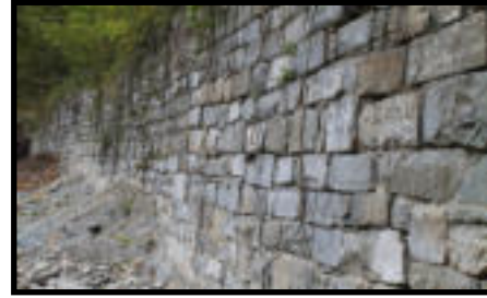
Şekil 67: İnaltı bölgesi demiryolu istinat duvarı kalıntısı.