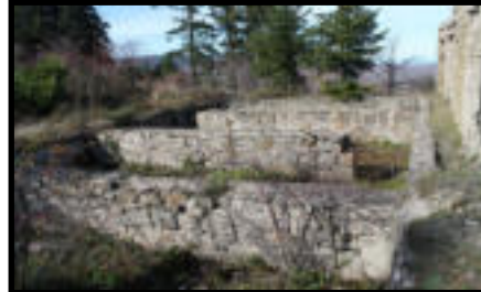
Şekil 37: Çölmektepe istasyonu lokomobilin su ihtiyacını karşılayan havuz.