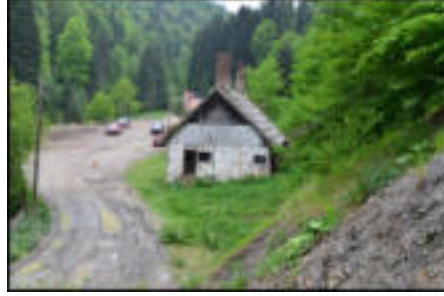
Şekil 61: Yemişli istasyonunda lojman.