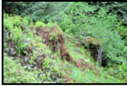
Şekil 47-48: Çangal bölgesi Virajköprü mevkii.