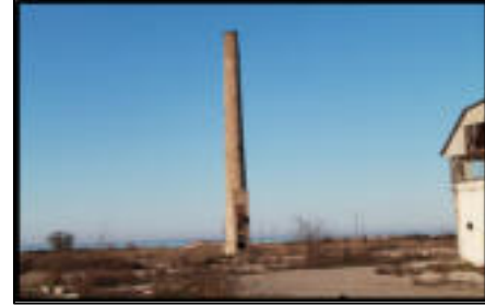
Şekil 83: Fabrikanın endüstriyel kalıntılarının hurda olarak satılmasından geriye kalan baca.