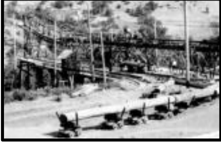
Şekil 41: Çangal bölgesinde havai hatta tomruk yüklenmesi.