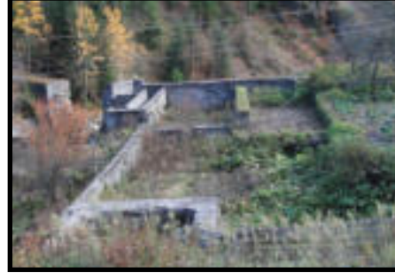
Şekil 63: Yemişli istasyonunda bulunan tomruk havuzu kalıntıları.