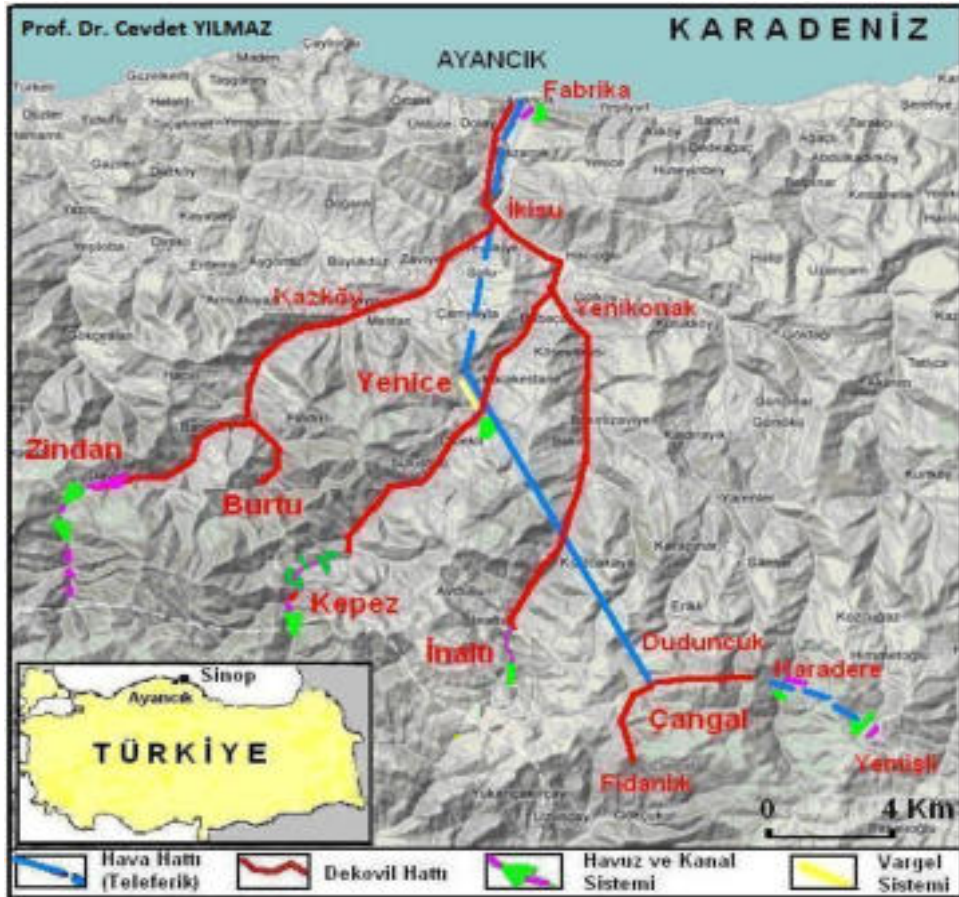
Şekil 1: Lokasyon haritası (Yılmaz, 2012'den).

Bu çalışmada endüstriyel miras turizmi potansiyelini belirlemek için araştırma alanı olarak seçilen Ayancık ilçesi, Kuzey Anadolu'da Karadeniz Bölgesi'nin Batı Karadeniz Bölümü'nde yer alan Sinop ilinin önemli ilçelerinden biridir. Batısında Türkeli, doğusunda Erfelek, güneyinde Boyabat ve Hanönü (Kastamonu) ilçeleri bulunur (Şekil 1).