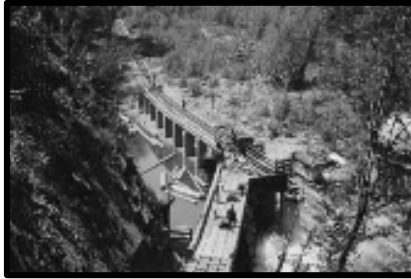
Şekil 32: Yenicealtı havuz başlangıcı.