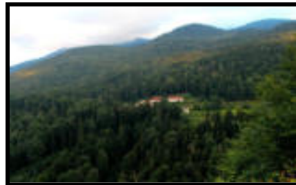
Şekil 39: 1930'lu yıllarda Çangal istasyonu.