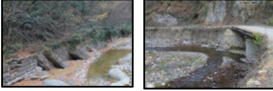
Şekil 76-77: Zindan bölgesi demiryolu hattı güzergâhında bulunan istinat duvarları ve köprülerden biri.