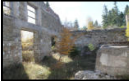
Şekil 36: Çölmektepe istasyonu güç üretim binasına ait kalıntılar.

Koordinat: 41° 44' 41,3" K - 34° 38' 03,7" D Yükselti: 1242 m