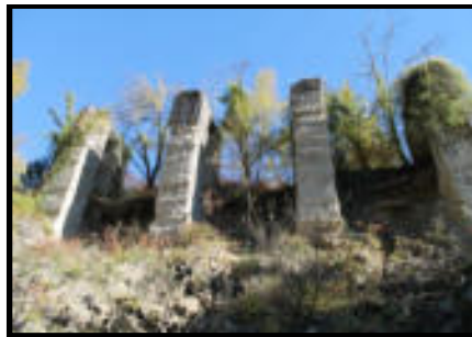
Şekil 28: Yenicealtı istasyonu eski hali.