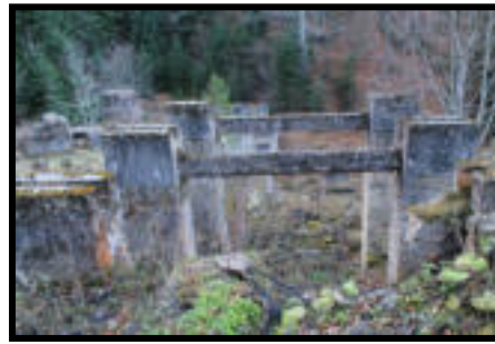
Şekil 54: Çukurçay istasyonu temel kalıntıları.