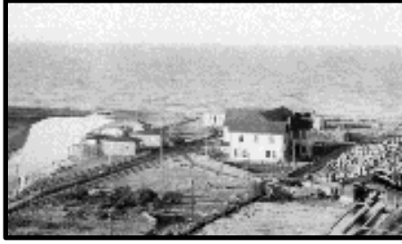
Şekil 78: Ayancık Kereste Fabrikası eski idare binası.

Ayancık ilçe merkezinde kereste fabrikası yerleşkesinde bulunan lojmanlar, idare binaları, sosyal tesisler ve endüstriyel kalıntılar endüstriyel miras niteliği taşıyan yapılardır. Fabrika yerleşkesi içinde toplam 17 bina ayakta kalarak günümüze ulaşmıştır ( Şekil 78 ). Bunlar 9 ustabaşı lojmanı ( Şekil 79 ), 1 müdür lojmanı, 3 sosyal tesis ( Şekil 80 ), 1 telefon binası, 1 idare binası, 1 vinç kontrol binası ( Şekil 81 ) ve 1 sunta imalathane binasından oluşmaktadır. Ayrıca yine bu yerleşkede fabrikaya tomruk taşıyan lokomotiflerden biri ( Şekil 82 ), yonga levha imalathanesinin bacası ( Şekil 83 ), tomruk havuzu ( Şekil 84 ), eski raylar ve gemilere kereste yüklemek için kullanılan mavnalar ( Şekil 85 ) bulunmaktadır.