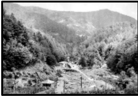
Şekil 74: Zindan bölgesinin havuzlar tarafından görünüşü.

Zindan bölgesi Ayancık'taki orman sanayinin Çangal'dan sonraki en önemli üretim merkezidir (Şekil 74-75). Bu bölgeye de bir havai hat yapılması planlanmış fakat sistemin işlediği Çangal hattında çıkan sorunlar burada yapılmasını engellemiştir. Bu bölgede kesilen tomruklar bölgenin kuzeyinde bulunan iki büyük havuzda toplanıyordu. Bu havuzların arasında sulu oluklar mevcuttu ve bu oluklarla tomruklar hareket ettiriliyordu. Havuzlarda biriktirilip oluklarla taşınan tomruklar bölgeden trenlere yüklenerek ilçe merkezindeki fabrikaya ulaşıyordu (Şekil 76-77). Bölgede 1988 yılında meydana gelen heyelan nedeniyle yükleme alanları ve tren istasyonu moloz altında kalmıştır.