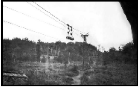
Şekil 22: Havai hat ile tomruk nakli.

Havai hattın güzergâhı 55 günde şeritle açılmıştır. Hattın faaliyete geçiş tarihi 8 Kasım 1932'dir. Saate 400 m 3 kereste nakledebilen bu havai hat için 70'ten fazla direk dikilmiştir (Şekil 22-23). Bunların en yükseği 94 metredir. Havai hattı kuran şirket merkezi Brüksel (Belçika)'da bulunan KUPE kuruluşudur (Kutlutan, 1938).