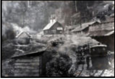
Şekil 51: Karadere istasyonu.