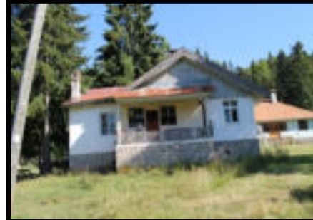
Şekil 45-46: Çangal istasyonu personel lojmanları.