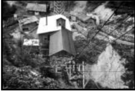
Şekil 55: Çukurçay istasyonu.