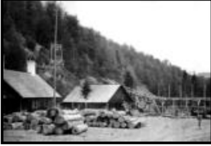
Şekil 60: Yemişli istasyonu.

Hattın en güney kesiminde bulunan başlangıç istasyonudur. 1936 yılında Çangal'da bulunan ana havai hatta Karadağ ve Yemişli serilerinden üretilen orman emvallerinin taşınmasında kullanılmak üzere inşa edilmiştir. Yakın çevreden kesilen tomruklar yük hayvanları ile sürütme yollarından taşınarak bu bölgeye getirilmekteydi. Bölgede günümüze kadar ulaşabilmiş olan lojmanın çatısı yörede eskiden çok kullanılan bir çatı örtüsü olan pedavra ile kaplıdır (Şekil 60-61). Burada havuza bırakılan tomruklar havai hatta yüklenerek Çukurçay'a gönderilmekteydi (Şekil 62-63). Bu havai hat ile Karadere istasyonuna kadar taşınan emvaller buradan dekovil hatları ile beraber büyük hava hattına nakledilmekteydi. Burada elektrik üreten bir jeneratör ile hayvanların barındırıldığı bir ahır bulunmaktaydı (Şekil 64-65).