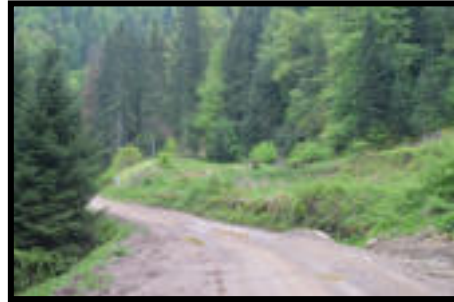
Şekil 52: Karadere istasyonun bulunduğu yer.