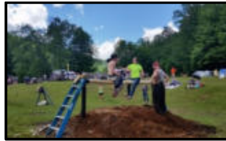
Şekil 86-87-88. Barkpeeler Festivali’nde ormancılık oyunları.

Ayancık Türkiye Ormancılığında çok önemli bir yere sahiptir. Bugün hala İşletme Müdürlüğü bazında Türkiye’nin en fazla orman emvali üreten merkezi durumundadır. Dünyada bu kültüre sahip olan merkezler bunu turizmle birleştirerek ekonomilerine önemli katkılar sağlarken benzer potansiyele sahip Ayancık bu tür bir organizasyondan niçin faydalanmasın?