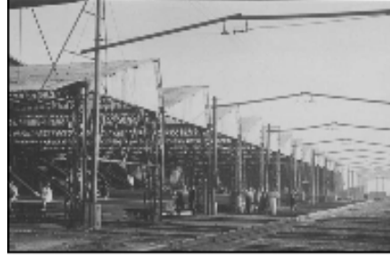
Şekil 17: Fabrika içinde ulaşım için kullanılan tramvay sistemi.