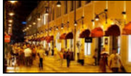
Şekil 8-9. Samsun Tütün Fabrikası'nın restorasyonu ile oluşturulan Samsun Bulvar Yaşam ve AVM. 17.400 metrekarelik bir alan üzerine kurulan ve 1.400 metrekaresi sosyal alan olarak tasarlanan Bulvar Samsun'da Anadolu mimarisinin tipik özelliklerinden olan iç avlular ile çok geniş bir meydan bulunuyor.