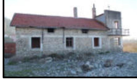
Şekil 81: Yükleme kontrol binası.