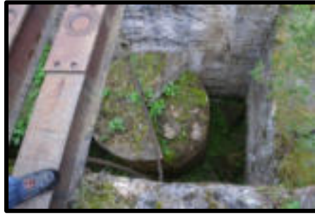
Şekil 56: Çukurçay'da telleri geren manivelanın beton ağırlık sistemi.