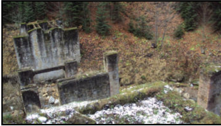
Şekil 57: Çukurçay istasyonu temel beton kalıntıları.