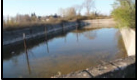
Şekil 84: Fabrikanın tomruk havuzu.