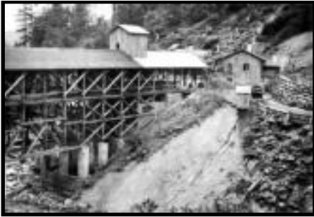
Şekil 53: Çukurçay istasyonu tomruk yükleme alanı.