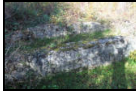
Şekil 26-27: Lefkenbaşı ist. güç ünitesi duvarı (solda) ve havuz (sağda).