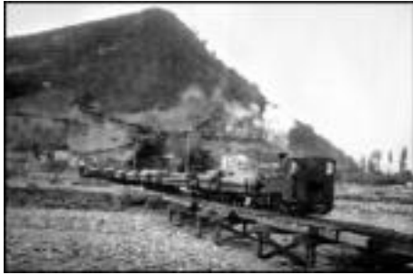
Şekil 20: Dekovil hattı ile tomrukların fabrikaya taşınması.

Türkiye'nin birçok bölgesinde yaşanan kırsal alandaki yol problemini Ayancık bu hat sayesinde aşmıştır. Dekovil hattını kullanan köylüler ihtiyaçlarını doğrudan şehirden sağlayabilmişlerdir. Sabah erkenden dekovillerle ilçe merkezine inen köylüler ihtiyaçlarını temin ettikten sonra akşam tekrar dekoville köylerine dönmüşlerdir. Bu durum Ayancık için geniş bir hinterlant sağlamış ve ilçe merkezindeki ticari hayatı canlandırmıştır (Şekil 21).