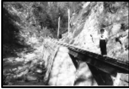
Şekil 68: İnalıtı demiryolu köprüsü.