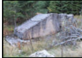
Şekil 58-59: Köşe istasyonu ayak kalıntıları.