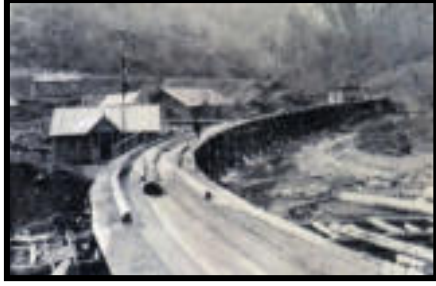
Şekil 18: Barajlarda biriktirilen tomrukların sulu oluklar üzerinden nakliyesi.

Tomruk taşımada önceleri yerli ve Avrupa'dan getirilen atlar (Macar Kadanası) kullanılmıştır. Fakat zamanla bu hayvanların bakımının zor ve maliyetinin yüksek olması nedeniyle yerli manda ve öküzlerin kullanımı yaygınlaştırılmıştır. Bu hayvanların tomrukları taşıyabilmesi için sürütme yolları yapılmıştır. O dönemde işletmeye ait yaklaşık 1.500 çift manda bulunmaktadır ( Şekil 19 ).