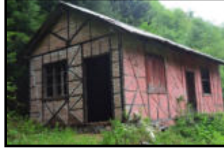
Şekil 65: Yemişli jeneratör binası.

Bu istasyonlar dışında çalışma sahasında havai hattın geçtiği alanlarda da bölümler halinde kalıntılar mevcuttur. Bu kalıntılar bir yerleşke ya da istasyon hüviyetinde değil sadece beton ayaklardan oluşmaktadır.