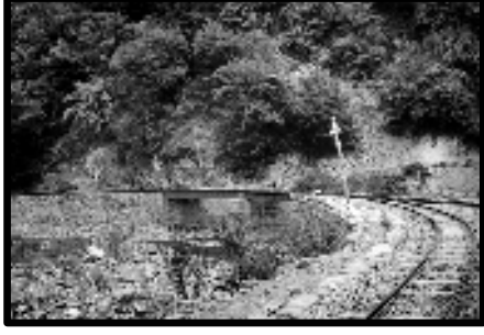
Şekil 72: Burtu demiryolu ayrımı.

kesilen ağaçları öküz ve mandalarla Burtu istasyonuna getiriyor, işçiler de bu tomrukları vagonlara yüklüyordu. Bu vagonlar Burtu'dan doğrudan doğruya fabrikaya gidiyordu. Burtu'da bir bekçi kulübesi kalıntısı ile tek katlı bir lojman bulunmaktadır (Şekil 73).