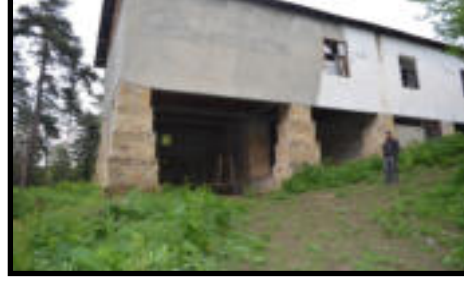
Şekil 42: Çangal istasyonunda bulunan havai hat iptal edilince istasyonun yükleme bölümündeki ayaklar üzerine inşa edilen bina uzun yıllar bölgede çalışanlara sinema olarak hizmet etmiştir. Günümüzde atıl durumdadır.