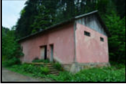
Şekil 64: İşletmeye ait manda ahırını.