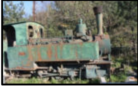
Şekil 82: Fabrikaya tomruk taşıyan lokomotiflerden biri.