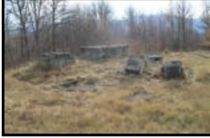
Şekil 34: Meydancık istasyonu güç ünitesi kalıntıları.