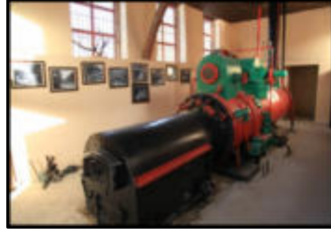
Şekil 43-44: Çangal Orman Müzesi ve müzenin içinde bulunan lokomobil.