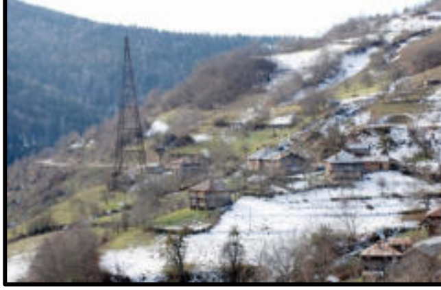
Şekil 38: Çangal bölgesi sistemden geriye kalan tek havai hat direği.

Koordinat: 41° 43' 33,1" K / 34° 38' 55,7" D Yükselti: 1085 m