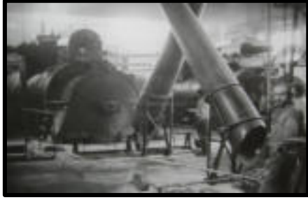
Şekil 16: Fabrika ile birlikte Ayancık'a elektrik veren lokomobil.

taşımak için havai hat ve dekovil hattından oluşan ana taşıma sistemi ve bu sistemleri besleyen hayvanlarla tomrukların taşındığı sürütme yolları, kuru ve sulu oluklar, var-gel hatları ve paletli traktörler kullanılmıştır. Kıyıya paralel uzanan Kuzey Anadolu Dağları derin vadilerle yarılmış vaziyette olduğu için iç kesimlerden ham madde taşımak için bu vadiler kullanılabilirdi. Fakat Ayancık Çayı ve kolları akarsu taşımacılığına uygun değildi. Bu sebeple bu vadilere dekovil hattı yapılarak değerlendirilmişti. Dekovil hattının uzanamayacağı alanlarda da dağları aşmak için havai hat kullanılacaktı. Bir elin parmaklarını andıran Ayancık Çayı havzası boyunca uzanan havai hat ve dekovil hattını da bahsettiğimiz tali taşıma sistemleri besleyecekti. Bu ulaşım sistemleri kullanılarak ormanda kesimi yapılan keresteler fabrikaya ulaştırılıyor, buradan da deniz yoluyla naklediliyordu (Tablo 2).