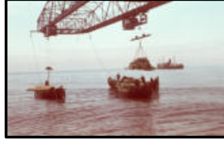
Şekil 12-13: Zıngal TAŞ tarafından kurulan vinç ve iskele.

Türkiye'de ormanın bilimsel olarak tanımlandığı ilk yasa kabul edilen ve 1937 yılında yürürlüğe giren 3116 sayılı Orman Kanunu'nun çıkarılmasında ve ormanların iltizam usulü yüklenicilerce (mültezim) işletilmesinin olumsuz etkilerinden kurtulmak için, özellikle Sinop Ayancık'ın Zindan ve Çangal ormanlarını işletmek için kurulan ZİNGAL TAŞ'nin bu ormanlar üzerindeki tahripkar uygulamaları dikkate alınmıştır (Birben, 2006:19). Nitekim 14 Mart 1945 tarihinde şirketin orman içi temizlik çalışmalarını ve gerekli ağaçlandırma çalışmalarını yapmadığı gerekçesiyle anlaşma tek taraflı olarak feshedilmiştir.