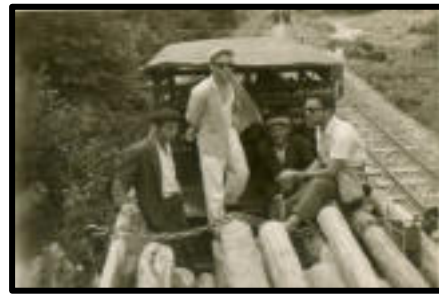
Şekil 21: Trenle şehre inen köylüler.