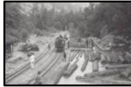
Şekil 33: Yenicealtı havuz sonu.