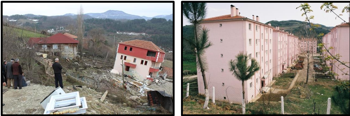
Foto 4. Sinop-Türkeli köylerinde yaşanan heyelanlar sonucu yıkılan meskenler ve bu tür felakete maruz kalan vatandaşlarımız için ilçe merkezine inşa edilmiş afet evleri.

Deprem, heyelan (Foto 4), sel, yangın gibi doğal veya köy boşaltmaları, terör gibi beşeri afetler sonucu (Yüceşahin ve Özgür 2006), ya da baraj suları altında kaldıkları için kamulaştırma gibi nedenlerle (Yılmaz 2014) köylülerin bir kısmı bizzat devlet eliyle kentlere yönlendirilmiş, ya da en azından (başta ilçe merkezleri olmak üzere) şehirlere göç bu yolla zorunlu hale getirilmiştir (Yılmaz 2005).