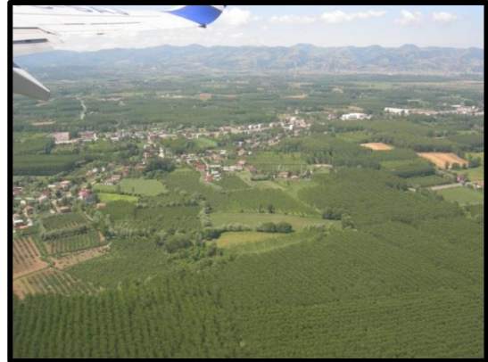
Foto 2. Çarşamba Ovası’nda tarlaların ekili halden dikili hale gelmesi (önce kavak, sonra fındıkla kaplanması) sonucu nüfus kaybeden köyler.