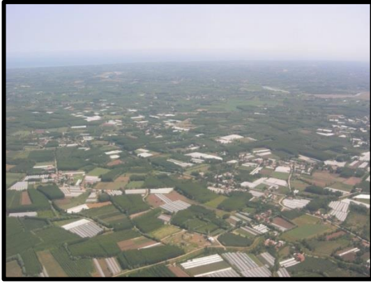
Foto 1. Çarşamba Ovası’nda Dikbıyık civarında seracılıktan da yararlanarak Samsun semt pazarları için sürdürülen sebze tarımı sayesinde (şimdilik) nüfuslarını muhafaza eden köyler.