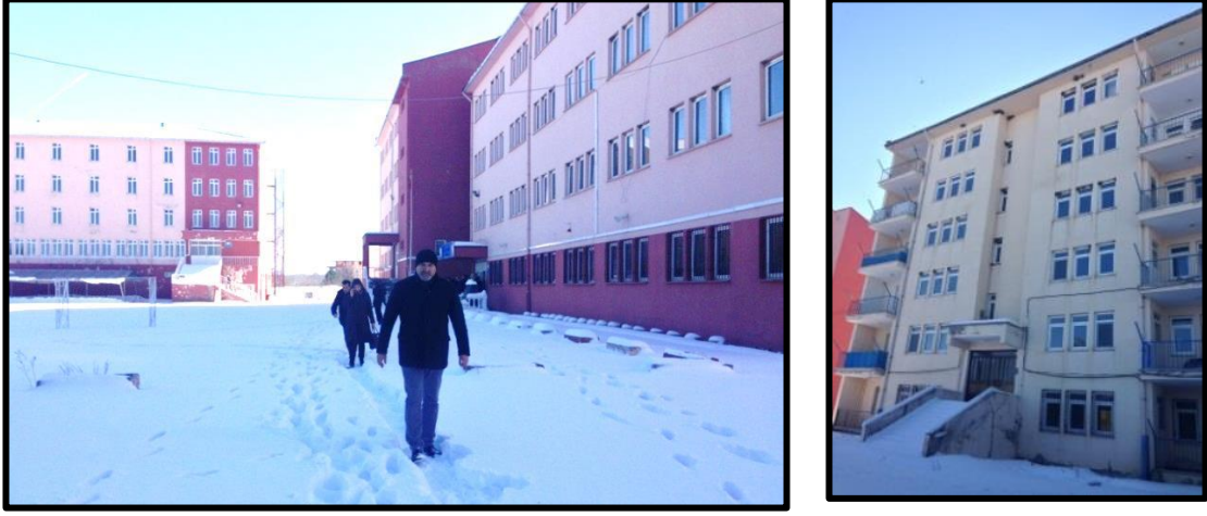
Foto 3. Samsun-Alaçam Göçkün köyü yatılı bölge okulu. Devasa yapı pansiyonu ve öğretmen lojmanları ile hayalet bina olmuş. Bir süre eğitim verdikten sonra öğrencisi olmadığı için kapanmış. Mevcut öğrenciler köylerden servislerle buraya gelmek yerine Bafra ve Alaçam ilçe merkezlerini tercih etmişler.

çıkmıştır. Bu süreç sonunda bazı merkezi köylerde kurulan yatılı bölge okulları zamanla boş kalmış ve terkedilmişlerdir (Foto 3).