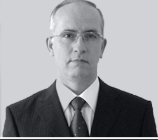
Prof. Dr. Cevdet YILMAZ