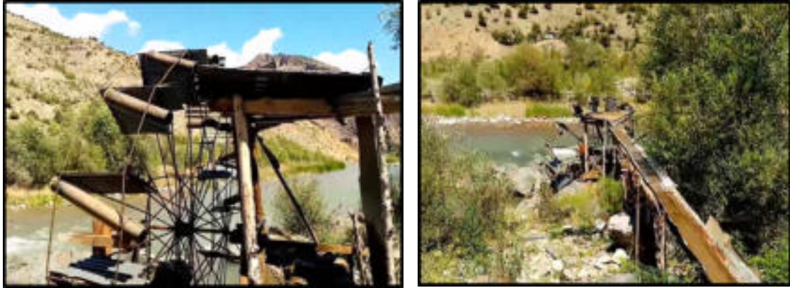
Foto 6-7: Çoruh nehri kenarında geleneksel yöntemler kullanılarak su çarkları ile çeltik karıklarına su verilmesi.

Çeltik köklerinin sürekli olarak su içinde bulunması gerekmektedir. Akarsuya yakın olan ancak su seviyesine göre yüksekte kalan çeltik tarlalarına sürekli olarak suyun aktarılması amacıyla su çarklarından yararlanılmaktadır (Foto 6-7). Su çarkları nehir kenarına yapılmıştır. Çark üzerine belirli mesafelerle su hazneleri yerleştirilmiştir. Su haznelerinin ağızları ve eğim doğrultusu çeltik tarlasına olacak şekilde dizilmiştir. Bu hazneler suyu tutabilecek plastik, metal gibi çeşitli atık maddeler kullanılarak yapılmıştır.