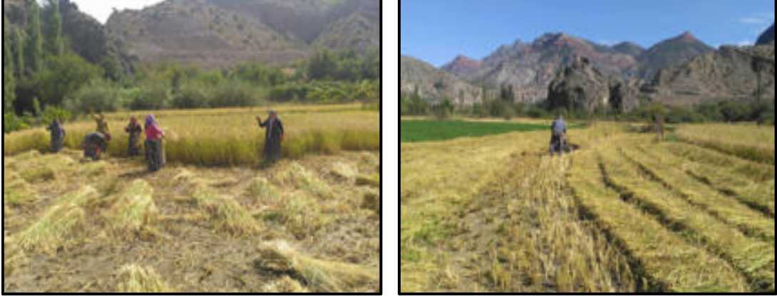
Foto 8-9: Çeltik; a) makinenin girmediği veya gerek görülmediği alanlarda geleneksel yöntem olan orakla, b) uygun olan yerlerde modern yöntem olan makinelerle biçilmektedir.

toprağa düşüp yeşermesini önlemek amacıyla bazen bir araya toplatılarak yakılmakta bazen de dere kenarına bırakılmaktadır. Çeltik tarımı ekiminden hasadına kadar sürekli uğraş gerektirmekte ve bu nedenle çeltik yetiştiricilerinin dediği gibi bin bir emek isteyen bir süreç olmaktadır.