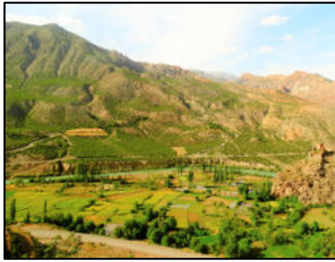
Foto 1: Çoruh nehri kenarında yer alan çeltik tarlaları, Yokuşlu köyü

Kaynak: TÜİK verilerinden yararlanılarak hazırlanmıştır.