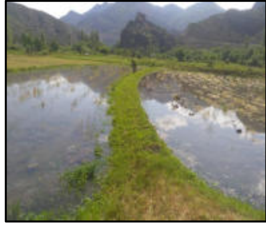
Foto 4-5: Çeltik tavalarında bir çift öküzle karık bulandırma ve karıklar arasında uzanan tump.