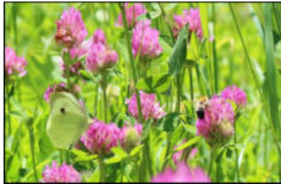
Foto 12: Çeltik hasadı esnasında yaralanmalarda kullanılan tıbbi bitki; Çayır üçgülü.

Çeltik tarımının el emeğiyle yapılması sürecinde karşılaşılan olumsuz durumlarda yine yerel imkânlarla çözüm bulunmaktadır. Çeltik, orak ile biçilirken genellikle eldiven kullanılmakta ancak yine de yaralanmalar olmaktadır. Bu durumda kadınlar tarla etrafında buldukları üç yapraklı , üç kulaklı , tadı acı ot şeklinde tarif ettikleri çayır üçgülü ( Trifolium pratense L.) bitkisinin yapraklarını çiğneyip kesik üzerine koyarak kanın akışını bu şekilde önlediklerini ifade etmişlerdir (Foto 12).