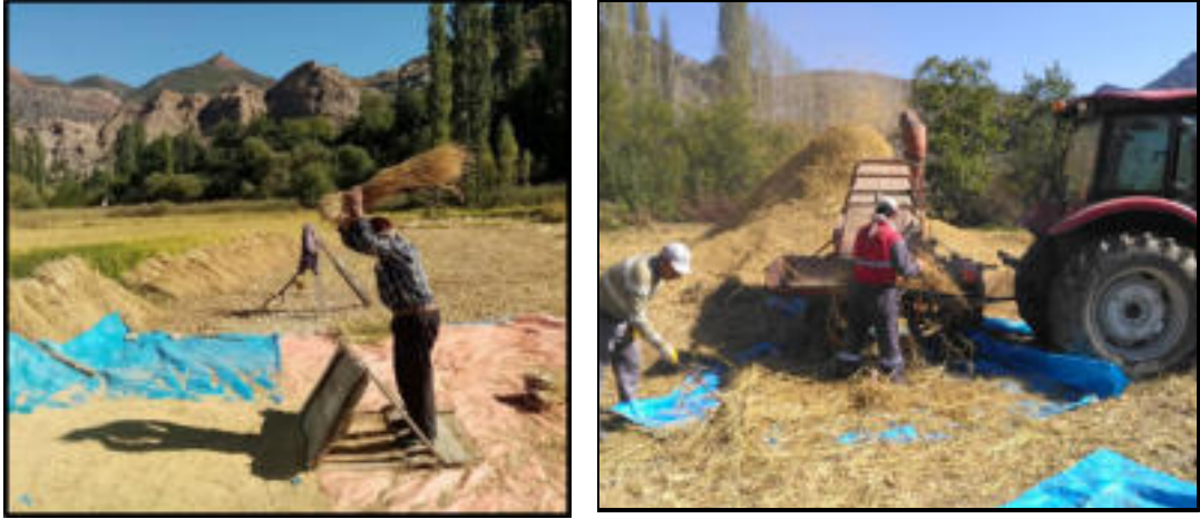
Foto 10-11: Çeltik tanelerinin geleneksel ve modern yöntemle ayrıştırılması.

Çeltik tarımının el emeğiyle yapılması sürecinde karşılaşılan olumsuz durumlarda yine yerel imkânlarla çözüm bulunmaktadır. Çeltik, orak ile biçilirken genellikle eldiven kullanılmakta ancak yine de yaralanmalar olmaktadır. Bu durumda kadınlar tarla etrafında buldukları üç yapraklı , üç kulaklı , tadı acı ot şeklinde tarif ettikleri çayır üçgülü ( Trifolium pratense L.) bitkisinin yapraklarını çiğneyip kesik üzerine koyarak kanın akışını bu şekilde önlediklerini ifade etmişlerdir (Foto 12).